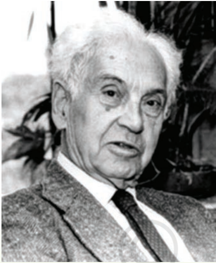
एरनस्ट मेयर (1904 - 2004)

एरनस्ट मेयर का जन्म 5 जुलाई, 1904 में केंपटन, जर्मनी में हुआ था। आप हावर्ड विश्वविद्यालय के विकासपरक जीव वैज्ञानिक थे, जिन्हें '20वीं शती का डार्विन' कहा गया। आप अब तक के 100 महान वैज्ञानिकों में से एक थे। मेयर ने सन् 1953 में हावर्ड विश्वविद्यालय की कला एवं विज्ञान संकाय में नौकरी प्राप्त की और 1975 में एलेक्जेंडर अगासीज प्रोफ़ेसर ऑफ़ जुलोजी एमीरिटस की पदवी के साथ अवकाश प्राप्त किया। अपने 80 सालों के कार्य जीवन में आपका पक्षी-विज्ञान, वर्गीकरण-विज्ञान, प्राणि-भूगोल, विकास, वर्गिकी तथा जीव विज्ञान के इतिहास एवं दर्शन आदि पर अनुसंधान केंद्रित रहा। आप ने लगभग अकेले ही विकासीय जीव विज्ञान के केंद्रीय प्रश्न जाति विविधता की उत्पत्ति को खड़ा किया, जो कि आज सच है। इसके साथ ही आपने हाल ही में स्वीकृत जीव वैज्ञानिक जाति वर्गिकी की परिभाषा की अगुवाई की। मेयर को तीन पुरस्कार दिए गए, जिन्हें व्यापक तौर पर जीव विज्ञान के तीन ताजों की संज्ञा दी जाती है: 1983 में बालजॉन प्राइज, 1998 में जीव विज्ञान के लिए इंटरनेशनल प्राइज और 1999 में क्राफ़र्ड प्राइज। मेयर ने 100 वर्ष की आयु में 2004 को स्वर्गवासी हुए।